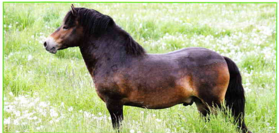
Abbildung 1: Exmoorhengst Felix (243/24), Leithengst der dänischen Herde mit den typischen Abzeichen

Dänemarks Natur besteht zu einem großen Teil aus Wiesen, Strandwiesen und Mooren. All diese Biotope stellen wichtige Lebensräume für diverse Tier- und Pflanzenarten dar, die Erhaltung dieser