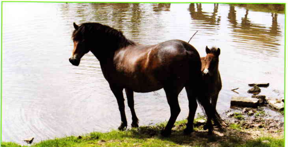
Abbildung 7: Exmoorponys im Tierpark Sababurg

Jedes Jahr im Herbst besucht uns eine Kommission der Exmoor Pony Society (EPS), um die Fohlen auf die Rassemerkmale zu überprüfen. Fohlen, die dem Standard entsprechen bekommen dann den Brand der EPS, die englische Raute und die Herdennummer auf die linke Schulter und die Individualnummer auf die linke Kruppe. Das Aussortieren der