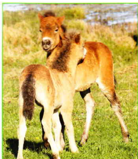
Abbildung 2: Zwei kaulende Fohlen

Lebensräume ist also besonders wichtig und wird dementsprechend streng überwacht. Eine besondere Art der Kontrolle stellt die Beweidung mit Großherbivoren dar. Die Flächen des dänischen Generaldirektorats für Natur und Forst werden traditionell mit Schafen und Kühen beweidet. Die Tiere sorgen dafür, dass in den Gebieten Büsche und Schilf nicht die Überhand gewinnen und dadurch seltenere Arten unterdrückt werden. Untersuchungen zeigen, dass Megaherbivoren nicht nur einen großen Einfluss auf die Struktur und Artenzusammensetzung der Vegetation haben, sondern Schlüsselarten sind, die Lebensräume für viele andere Arten schaffen und erhalten. Im südlichen Langeland wurde 2006 ein Projekt mit einer Herde Exmoorponys gestartet, die das Gebiet ganzjährig beweidet. Pferde gehören zu den Raufutter-Fressern, welche in ihren Wildformen in Europa nach Arten- und Individuenanzahl nicht mehr ausreichend vorhanden sind. Die extensive Beweidung stellt eine besonders naturnahe Form der Landnutzung dar, denn sie fördert die Entwicklung unterschiedlicher Lebensräume. Habitatvielfalt. landschaftliche Diversität