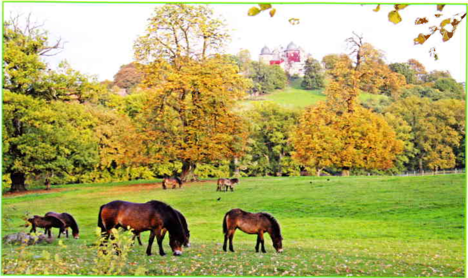
Abbildung 6: Saba's Glücksburg (324/4) mit ihrem Stutfohlen (geb. 18.04.2009)

nutzte das Gestüt Beberbeck das Gelände für ihre Pferdezucht. Das Gestüt züchtete eine eigene Pferderasse, die „Beberbecker“, welche bei der preußischen Armee äußerst beliebt waren und in großen Mengen ans Militär verkauft wurden, um in den Preußenkriegen eingesetzt zu werden.