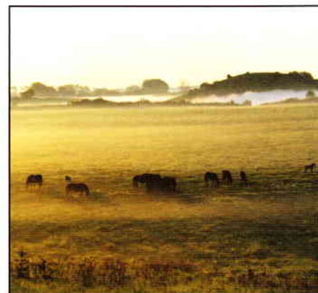
Abbildung 3: Exmoor im Morgengrauen

Um einen guten Überblick über die Habitatnutzung und das Verhalten der Exmoorponys zu bekommen, wurden die Tiere innerhalb dieser drei Monate jeden Tag mehrere Stunden täglich beobachtet, jeweils zwischen 05.30 Uhr und 22.30 Uhr. Die Herde bestand zu dieser Zeit aus 31 adulten Tieren (1 Hengst, 23 Stuten, 7 Jährlingsstuten), im Laufe des Jahres wurden insgesamt 19 Fohlen geboren, von denen 14 das Jahr 2008 überlebten. Hauptfohlzeit war im April und Mai. 63,1% der Fohlen wurden in diesen zwei Monaten geboren, nur 36,9% kamen früher oder später im Jahr zur Welt.