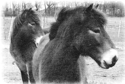
Exmoorponys sollten die ursprüngliche Robustheit nicht verlieren. Barney Rubbles und Winston im Winterfell